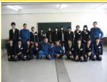
愛知県一宮消防署 救急隊