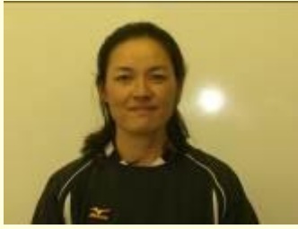
岐阜経済大学 スポーツ指導職員