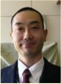
朝日大学 経営学部 経営学科 教授