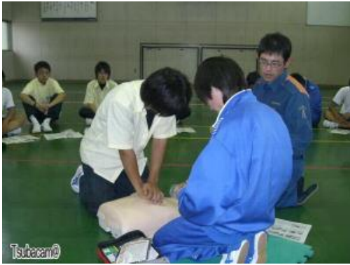
一宮市尾西消防署 救急隊職員